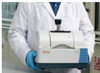
ノートPCサイズで軽量